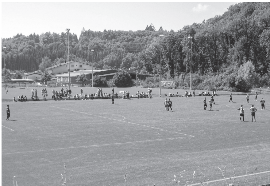
Die Fussballfelder der Sportanlage «Schweizersbild».

In der Sportanlage «Schweizersbild» gibt es heute drei Naturrasenfelder. Um die steigende Nachfrage befriedigen zu können, sollen die Beleuchtung und die Bewässerung der bestehenden Felder verbessert werden. Zudem soll eines der Naturrasenfelder in ein Kunstrasenfeld umgebaut werden. Kunstrasen ist im Ver-