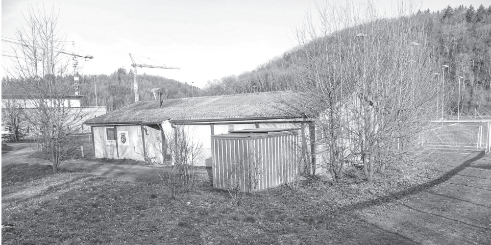
Bestehendes Clubhaus, Standort für den Ersatzbau des Garderobengebäudes.

in einem ungenügenden Zustand. Auf dem Areal befindet sich eine Baracke im Eigentum des «Sporting Clubs», welche dieser als Clubhaus nutzt. Der Pachtvertrag mit der Stadt ist 2014 ausgelaufen und wird seitdem nur noch jährlich verlängert. Die Baute ist in einem sehr schlechten Zustand und energetisch ungenügend isoliert. Mit dem Bau des NHTLZ musste ein Materialraum in der «Schweizersbildhalle» für die Fussballplätze aufgegeben werden. Aktuell wird das Material in einem provisorischen Blechcontainer aufbewahrt.